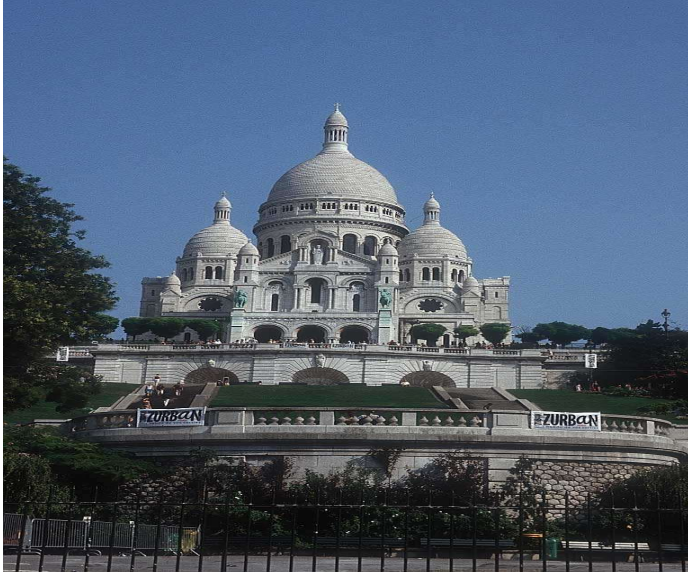
SACRE COEUR -PARIS