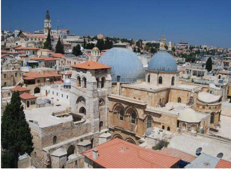
BISERICA SFANTUL MORMĂNT DIN IERUSALIM