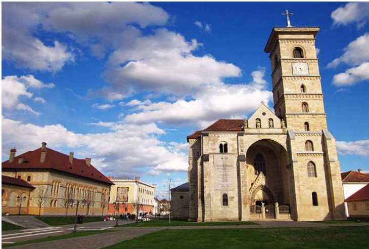
CATEDRALA DE LA ALBA IULIA-romanicul târziu